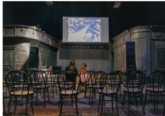
Het Animatie Parlement