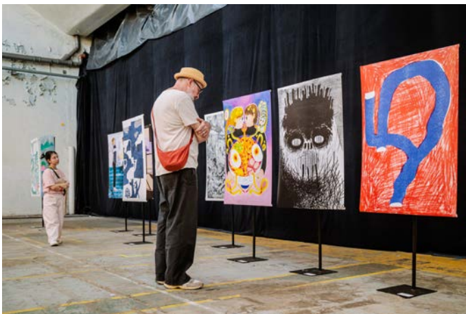
Ao posterexpo

downloaden op www.tuig.rocks/pers (vergeet niet fotograaf te vermelden).