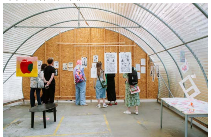
Expo zine in de kijker