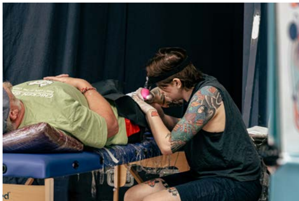
Tattoo op het TUIGfestival