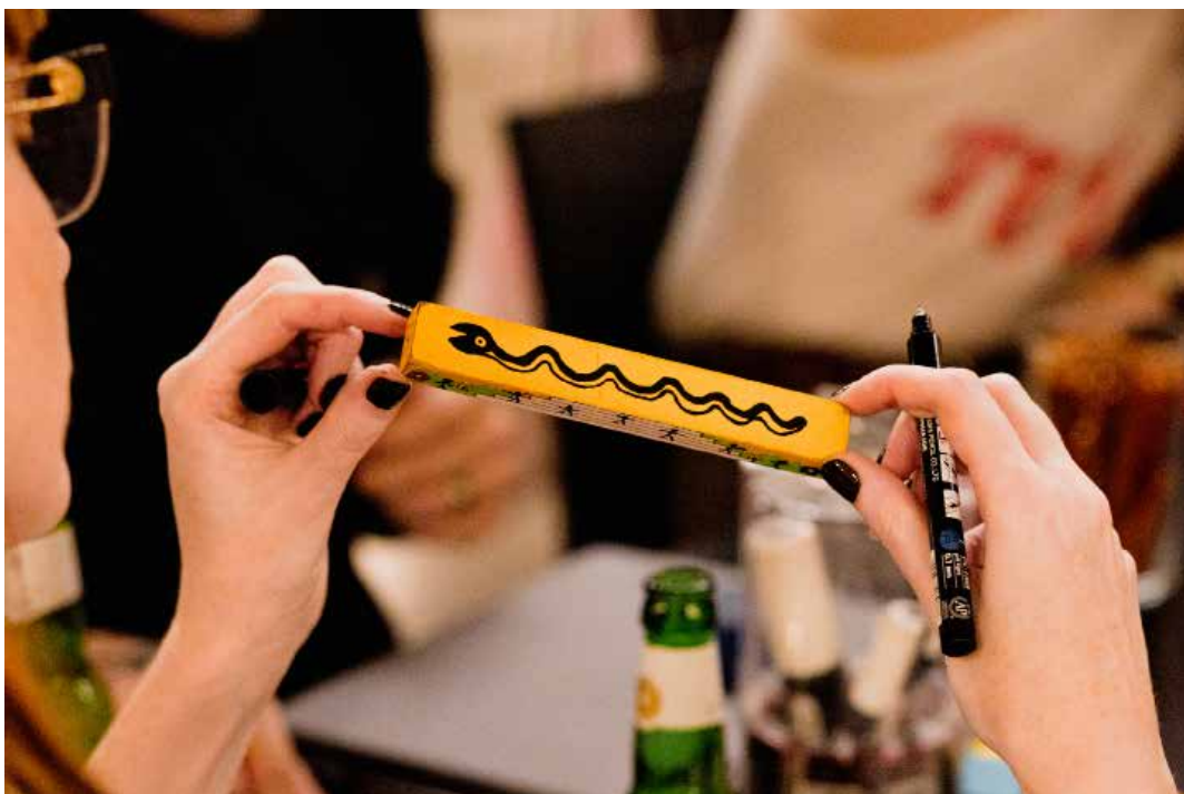
drink & draw