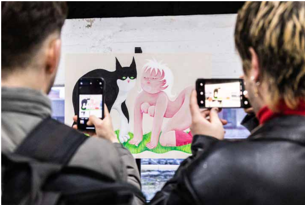
expo poezen in het bos 02

Enkele foto's van onze voorbije evenementen, meer foto's opvragen? Stuur een mail naar info@tuig.rocks