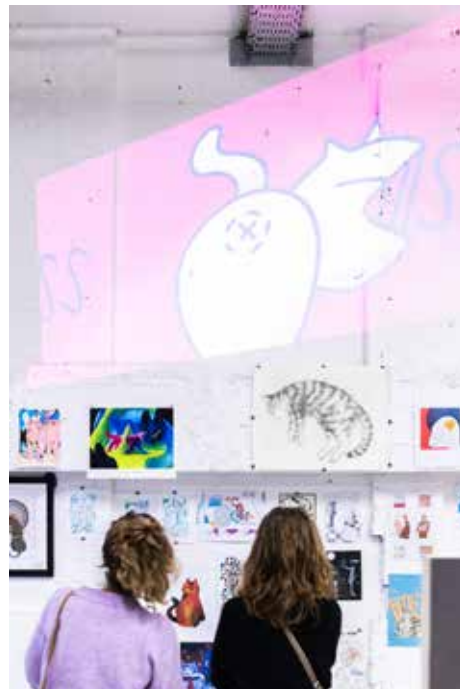
expo poezen in het bos 01